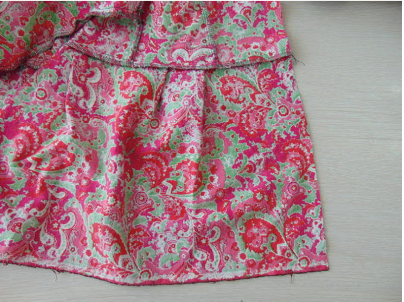
Юбка сзади. Вся юбка одна деталь.

Закладываем складки на юбке, скалываем с верхом, совмещая надсечки. Сшиваем и обметываем.