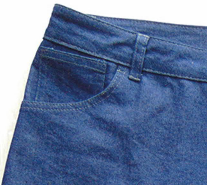
Боковые карманы с бочком

Для пошива подойдет плотная нетянущаяся ткань, или немного стрейч. Также нужна хлопковая ткань для боковых карманов 25 см, замок и пуговица.